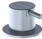
500 Mezclador monomando 1 1/4" sobre encimera.