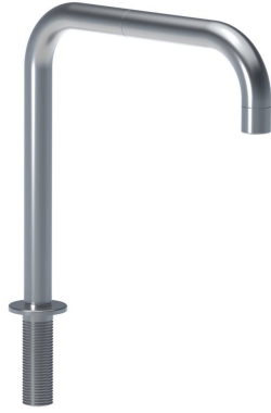
090 Caño giratorio doble. Altura de 210 mm. Orificio caño: 22 mm.